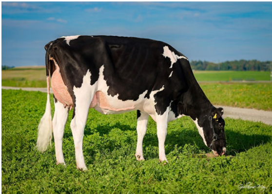
DU PRIEURE MAROON SG GOLDEN BINGO DAUGHTER