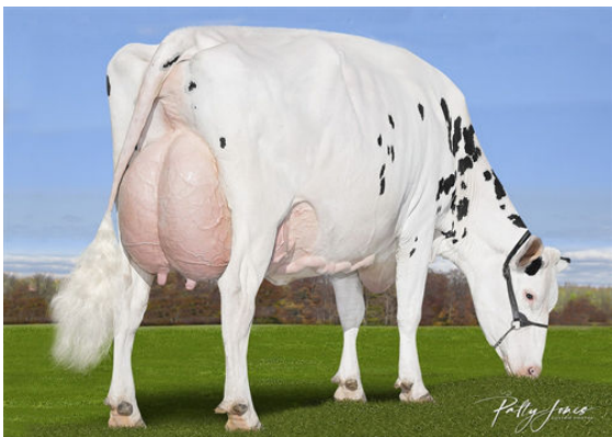
CALBRETT KINGBOY MIRANDA P THIRD DAM